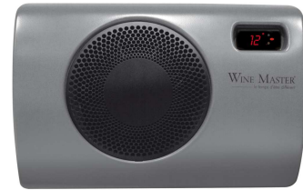
C25 C25S C25SR

• Les WINEMASTER® C50S et C50SR climatisent jusqu'à 50m 3 *.