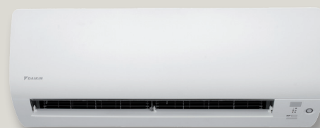
CTXS-K / FTXS-K