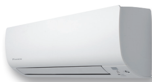
CTXS-K / FTXS-K